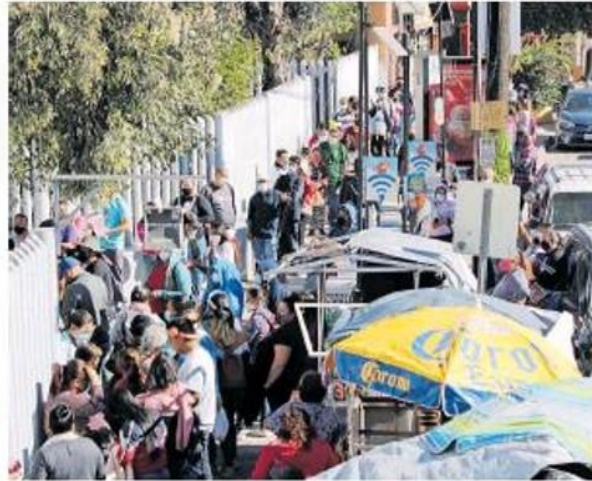
El sector salud informó que se tiene un registro de 818 casos activos